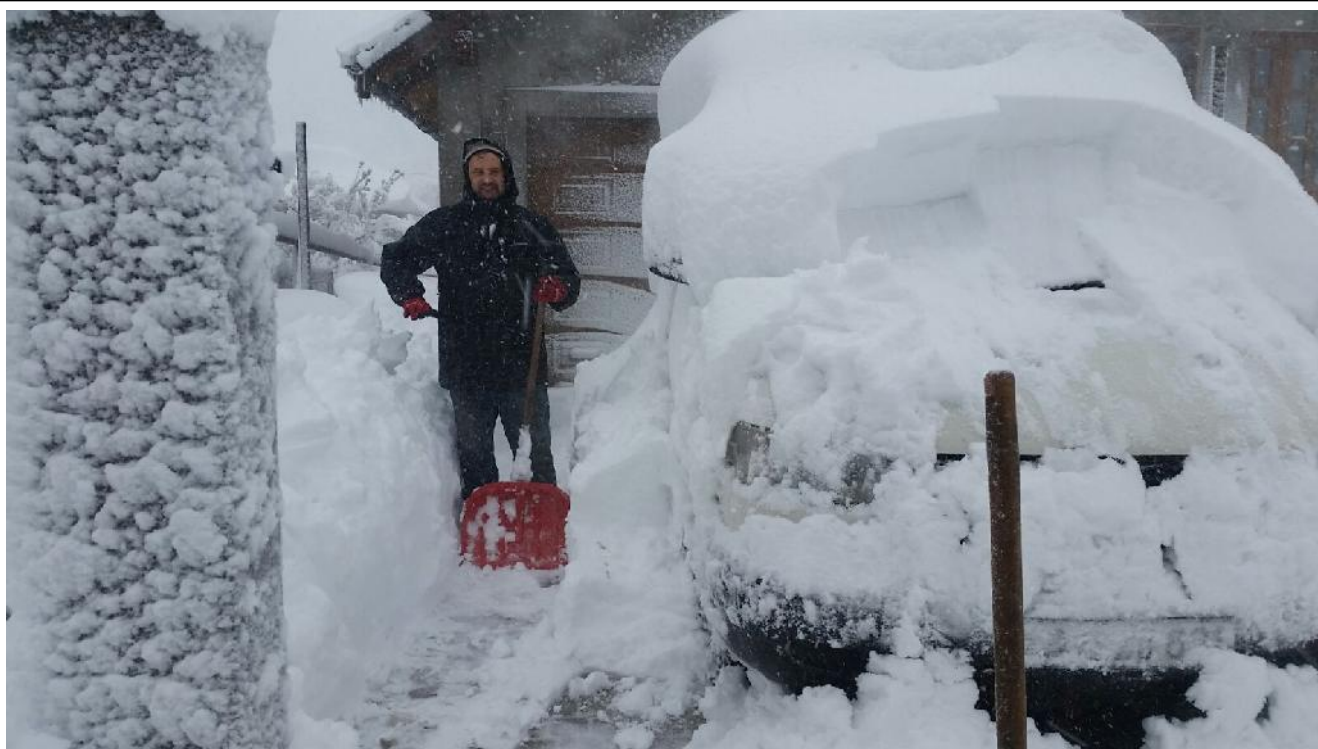
Toen nog eens 60 cm op 21 april. Moeten we daar heen? 23 april was het 17 graden.