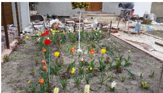
Mooi tuintje bij Anatol op 20 april. Daarna 13 cm sneeuw er op.